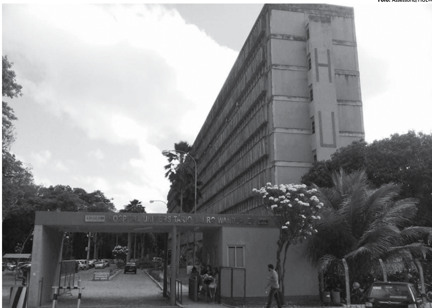
O novo serviço de telemedicina atenderá a demanda de pacientes com enfermidades crônicas, como diabetes, cardiopatias e doenças reumatológicas

“O paciente que estava em tratamento quando foi suspenso o atendimento no hospital, entra em contato. É feita uma triagem e vai ter duas alternativas: se o paciente tiver internet, é agendado através do Microsoft Teams, um teletendimento e o médico vai entrar em contato com ele em uma videoconferência. Se ele não tiver internet, será feita uma conversa via whatsapp. Outro tipo de atendimento é uma triagem ativa onde existe uma lista de nomes e telefones e nós entramos em contato fazendo um agendamento tanto no Teams como no Whatsapp”, esclareceu em entrevista ao Jornal Estadual da Rádio Tabajara.