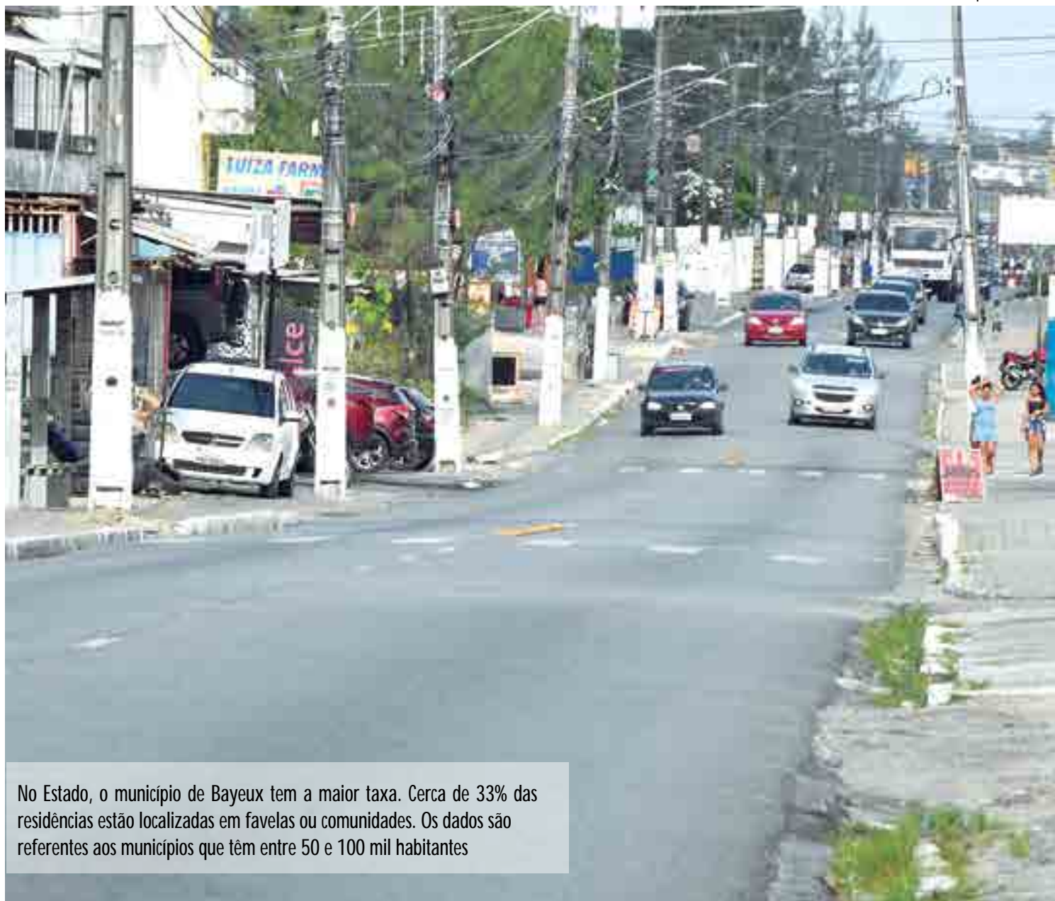
No Estado, o município de Bayeux tem a maior taxa. Cerca de 33% das residências estão localizadas em favelas ou comunidades. Os dados são referentes aos municípios que têm entre 50 e 100 mil habitantes

O coordenador de Geografia e Meio Ambiente do IBGE, Cláudio Stenner, observa, contudo, que