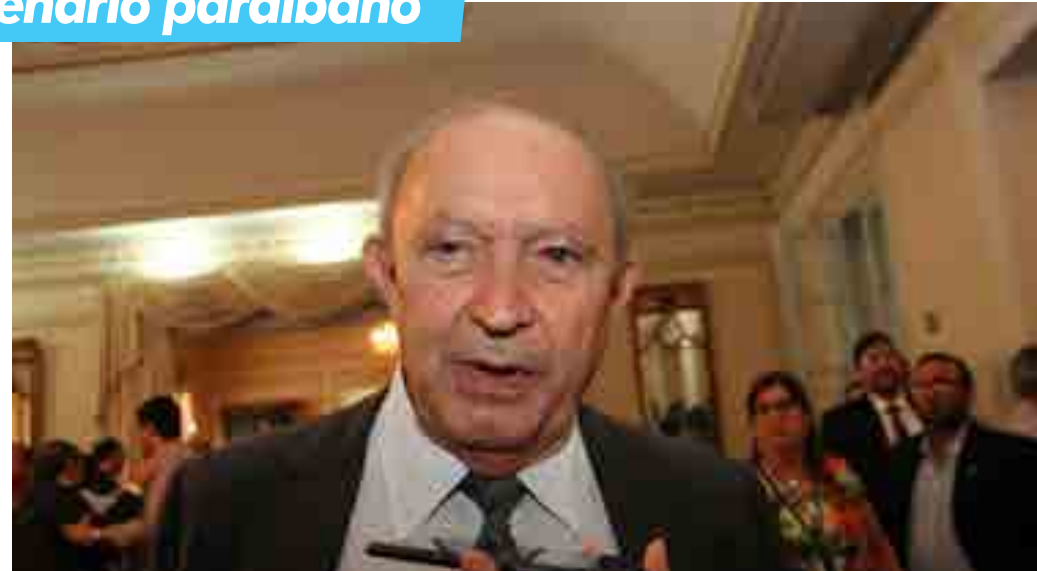
Presidente da Fiep, Buega Gadelha, falou sobre a situação da indústria durante entrevista à Rádio Tabajara