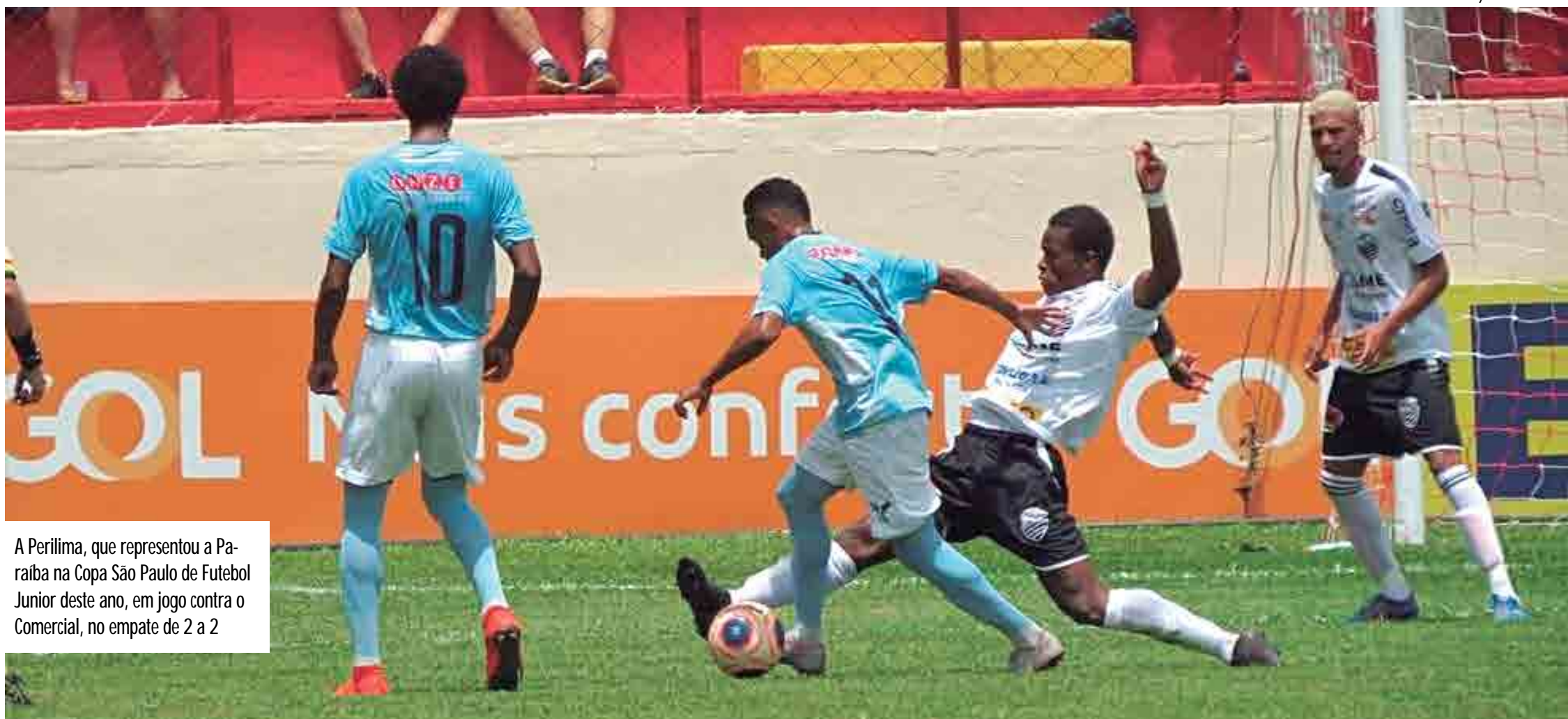
A Perilima, que representou a Paraíba na Copa São Paulo de Futebol Junior deste ano, em jogo contra o Comercial, no empate de 2 a 2