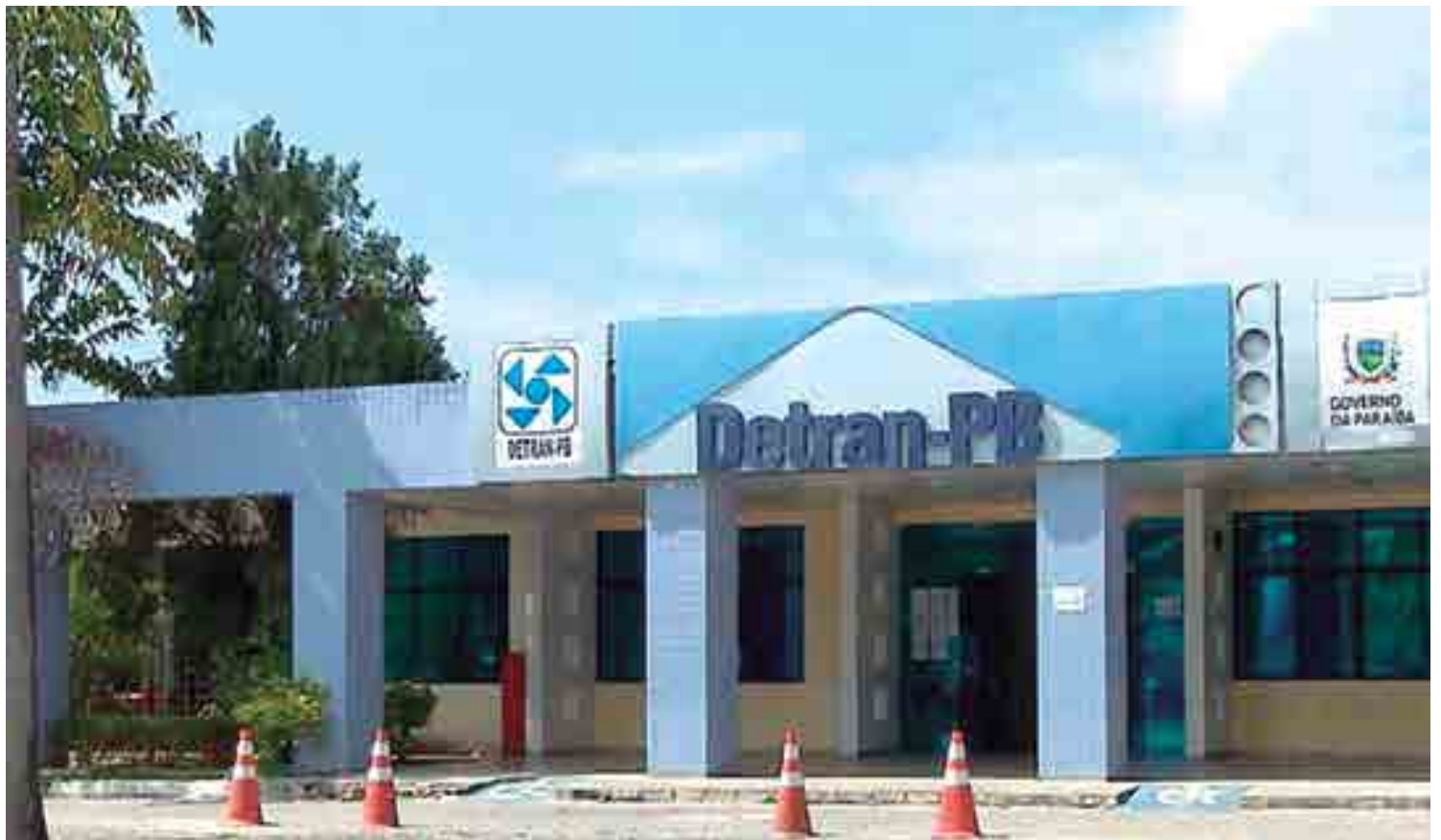
O Detran-PB expediu nova portaria, ontem, prorrogando a suspensão do atendimento presencial nas dependências do órgão até o dia 31 deste mês

Nesse passo, o sistema mostra uma tela de confirmação e gera um protocolo; o usuário clica em "Imprimir". Esse documen-