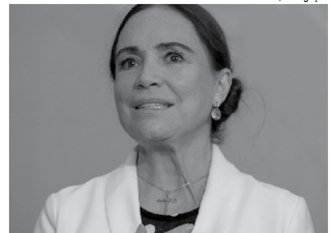
Regina Duarte, secretária especial da Cultura, na cerimônia de posse